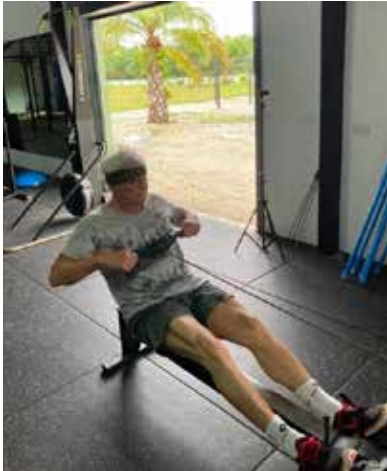
Palme im Hintergrund!

2) Diese drei Bilder laden dazu ein, eine Geschichte zu entwickeln und zu schreiben!