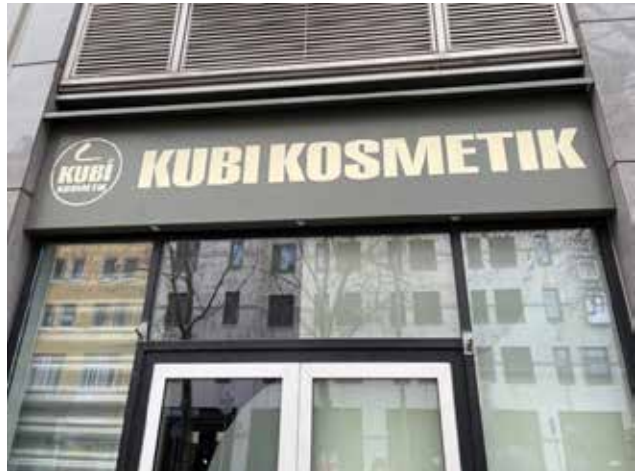
München, Nähe Hauptbahnhof